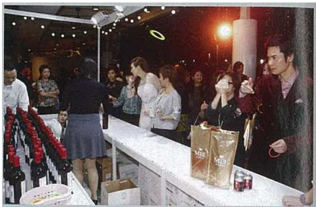
▲ 鄭嘉穎聚精會神玩遊戲，要將膠圈圈中紅酒需要一定技巧，過程之中，嘉穎擺出至chok眼神，不知電暈了多少粉絲？